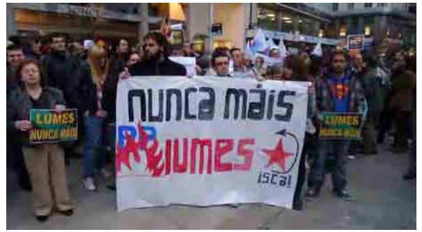
Mobilización na Corunha de resposta ao incendio nas Fragas do Eume

Por outra banda, e tamén cun forte rexeitamento por parte do pobo galego, comezou a porse en andamento a iniciativa de instalar unha planta de incineración de residuos no Irixo, que viría a estender o modelo Sogama ao sur da Galiza.