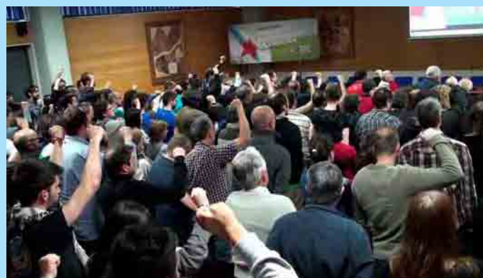
Imaxe do acto de clausura da AN do MGS, que contou coa intervención dunha representante de Isca!

pode dar resposta aos descarnados ataques do capital e pode articular de xeito unitario unha necesaria vía de ruptura con España e co capitalismo, para o cal o papel do BNG como ferramenta frentista e unitaria tórnase imprescindible. ●