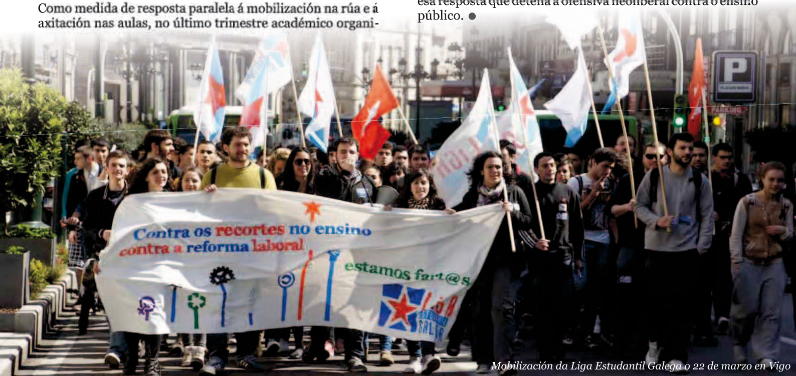
Mobilización da Liga Estudiantil Galega o 22 de marzo en Vigo

Por iso, hoxe máis que nunca é fundamental que o estudantado sexa consciente da importancia de organizarse para artellar unha resposta forte e decidida. O discurso contestatario debe acompañarse dunha práctica igualmente combativa, e só da organización das e dos estudantes pode xurdir esa resposta que deteña a ofensiva neoliberal contra o ensino público. ●