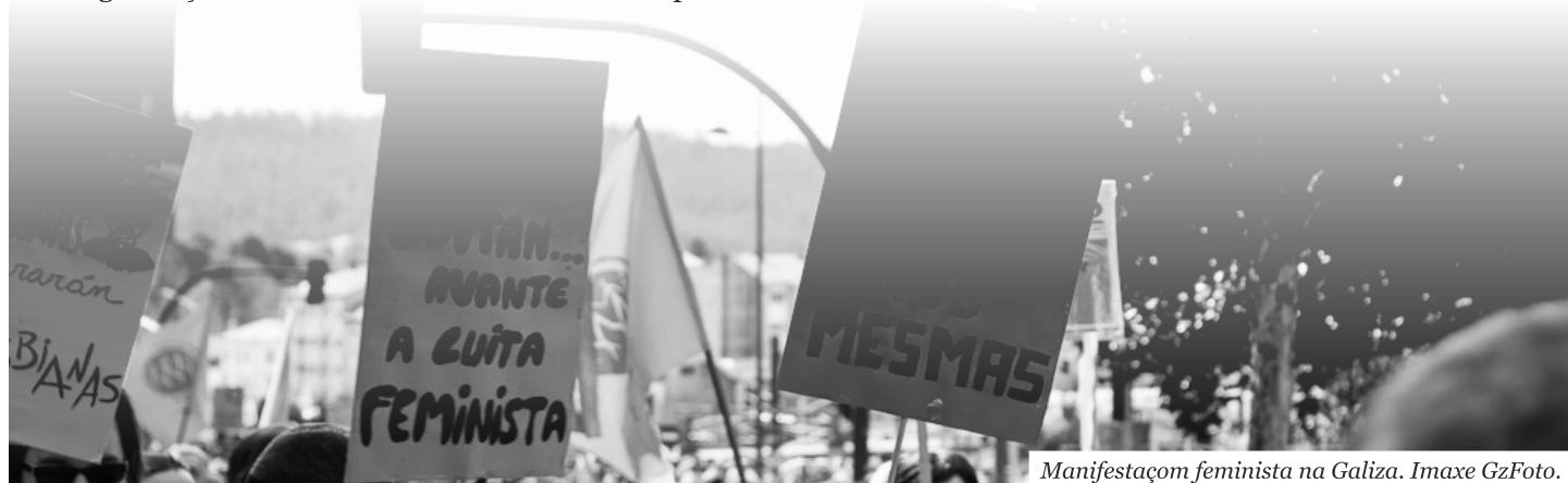
Manifestaçom feminista na Galiza.

A conclusom é que os protocolos nom servem de nada se nom há um compromisso real por mudar as nossas aççons, e convertem-se nalgo estético quando umha organizaçom deve tê-lo, como um “mínimo” a cumprir, como se avançássemos algo unicamente com isso. As nossas análises, como revolucionárias, devem ser radicais, mas o realmente importante e transformador é que seja radical a nossa praxe. Ter agressores nas nossas filas é um problema, e os problemas há que solucioná-los, e deveríamos ser exemplares à hora de fazer isto. Devemos depurar os espaços políticos porque som nossos, porque a segurança é o primordial e porque há umhas regras, e só aceitaremos a quem as vaia assumir e quem vaia actuar coerentemente. Se os homens agridem companheiras em espaços militantes, como se supom que vam ser participes activos da criaçom do novo mundo, aquele sem violências e opressons? Quem nom toma a sério a luita das mulheres, e mesmo quem a emprega para lavar as mans, tem que ficar fora; nom imos permitir que lastredes o avanço imparável do feminismo. ●