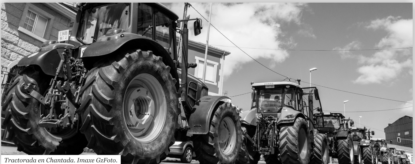
Tractorada en Chantada.

Para rematar, é moi importante que a mocidade galega teña un papel activo na loita de clases no rural impulsando os convenios colectivos: muxidoras, operarias agrícolas, podólogas, veterinarias... son moitas as profesións que traballan sen un convenio colectivo que as regule e defenda do empresariado. ●